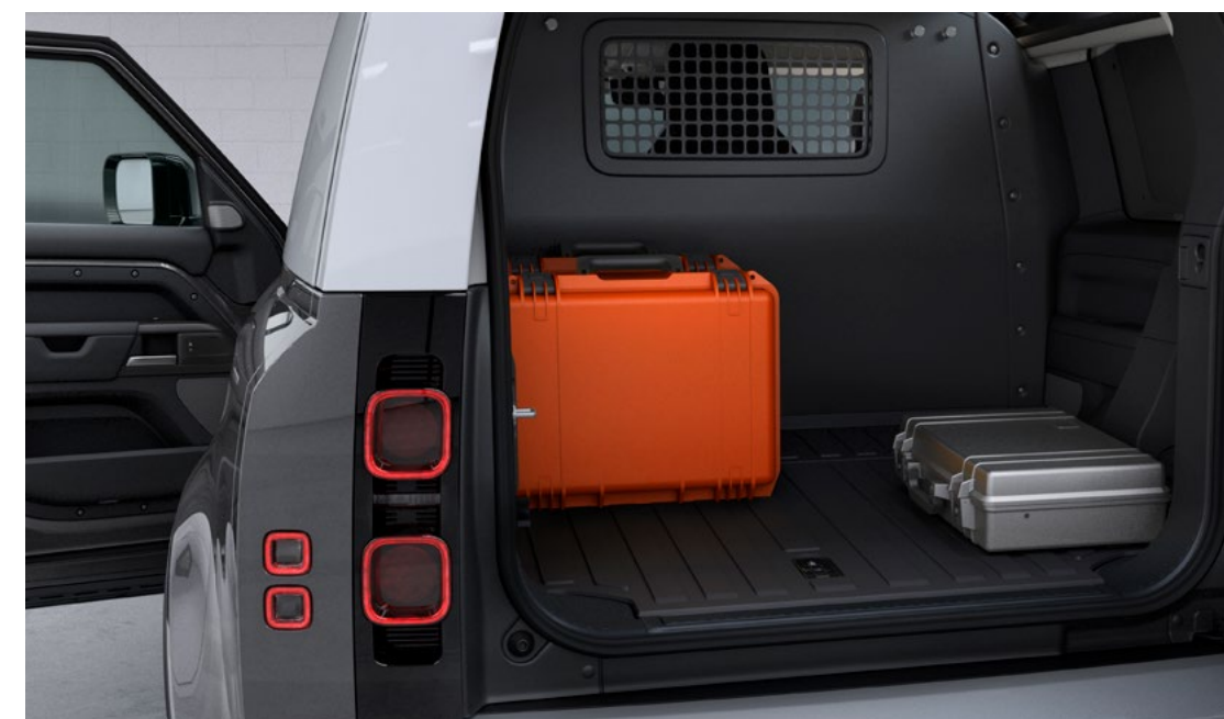
DEFENDER 90 HARD TOP