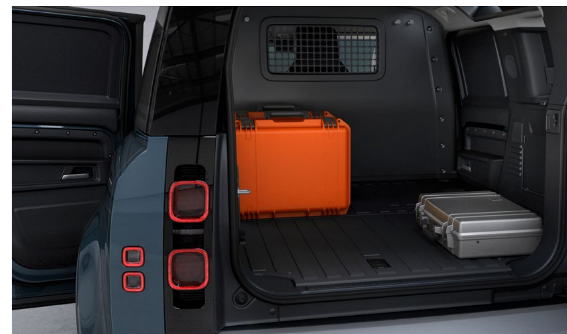
DEFENDER 110 HARD TOP